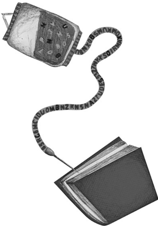
Ilustración de Irma Bastida.

Una inmensa y sorpresiva alegría, producto del esfuerzo de un equipo editorial que día a día muestra respeto y libertad en el trabajo que realizan cada uno de sus integrantes, así como del apoyo cálido de familiares y amigos; y las enseñanzas que con tanto cariño