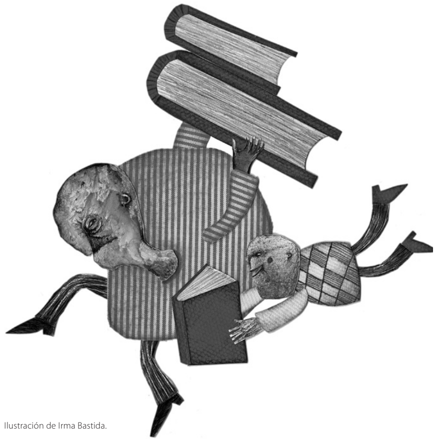
Ilustración de Irma Bastida.

comparte la gente con quien he tomado y compartido talleres.