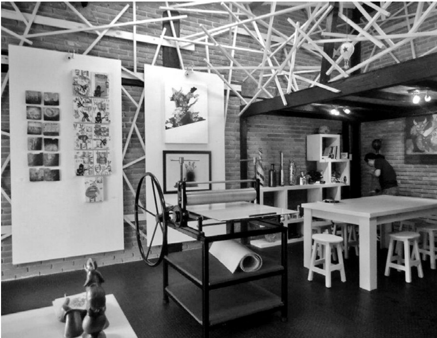
Taller de la ilustradora.

completo. En cuanto a la temática, resultan más interesantes aquellos textos donde el contenido es más complejo, como los ensayos o la poesía, que permite jugar bastante con las imágenes.